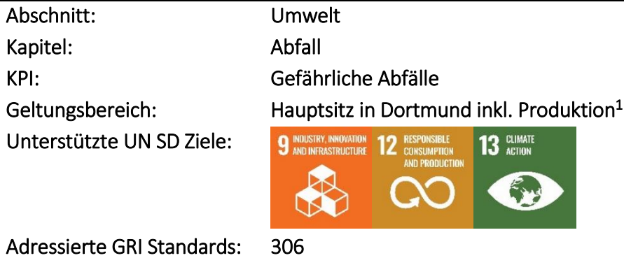
Gefährliche Abfälle 2 (t)